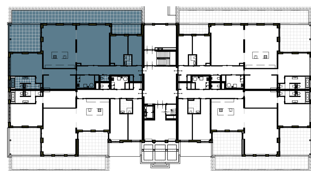
BEGANE GROND (PEIL = 0)